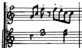
Abb. Klarinette und Horn (D):